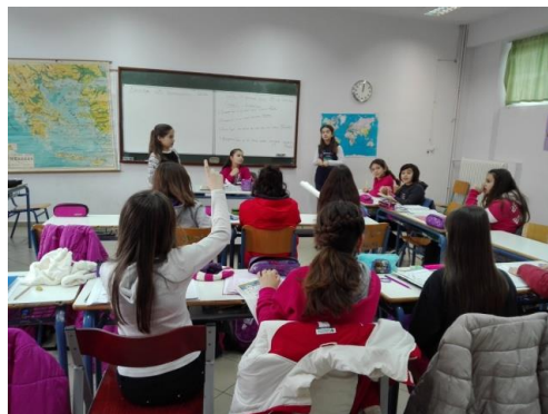
Εικόνες από συμβούλιο σε τάξη δημοτικού σχολείου